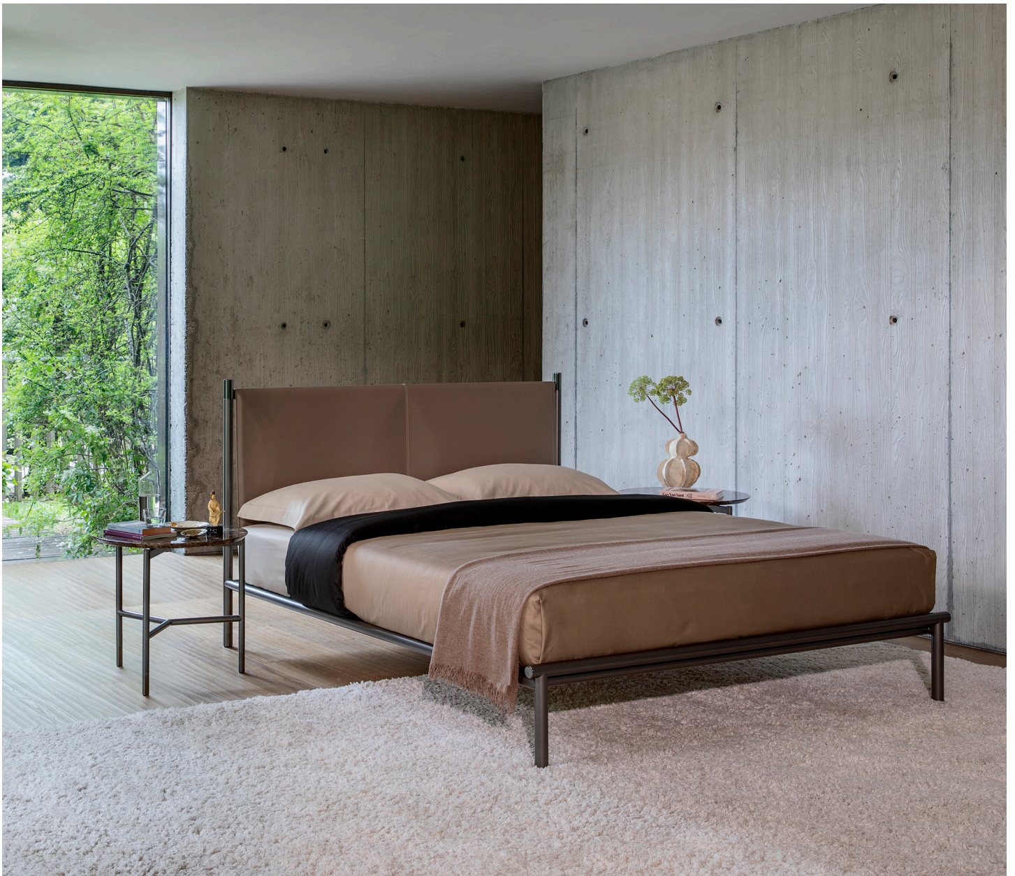
IKO DOPPELBETT design Rodolfo Dordoni 2015

Eleganz, Exklusivität und nicht zur Schau gestellter Luxus zeichnen dies Ehebett aus. Seine scheinbare Schlichtheit besticht durch die reinen Linien, die verwendeten hochwertigen Materialien und die raffinierten Details. Die aus Stahlrohr bestehende Bettstruktur ist in den Oberflächenfinishes brüniert matt erhältlich. Details aus Gold glänzend oder Nickel schwarz glänzend. Kopfteil aus Leder erhältlich in den Farben: Natur, Mokka, Schwarz, Bulgarisch Rot, Tabak, Sand, Schlamm, Haselnuss, Taubengrau, Asche und Mastix.